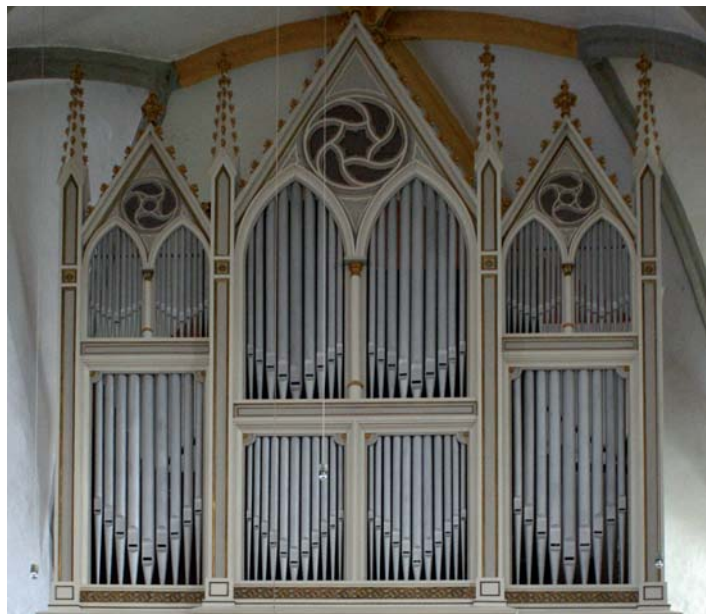
Der neogotische Prospekt der heutigen Rühlmannorgel